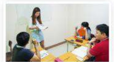
少人数生のグループクラスではディスカッションを通して、英語で自分の意見を話してみましょう。