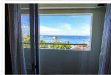
綺麗な海が一望できる爽やかな目覚め