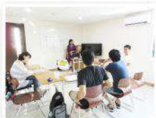
勉強型とリラックス型のオプションクラスがあり、授業にプラスして取れる選択クラスです。