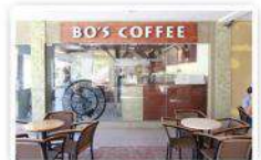
スーパーやモール、カフェ等も近くにあるので授業後にお出かけ可能です!