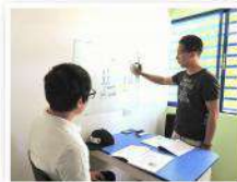
会話量が多いマンツーマン授業でしっかり苦手を克服しましょう!