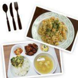
ブルーオーシャンでは多国籍な学生に合わせた様々な料理を提供します。