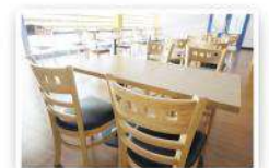
ホテルの部屋やマンツーマンの教室や1階のカフェで習った内容の復習ができます。