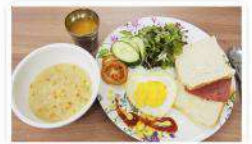
朝食はしっかり食べましょう。